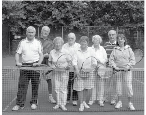
Een aantal leden van de tennisclub

Als u dit leest, is ons tennisseizoen inmiddels afgesloten met een gezellig ententje.