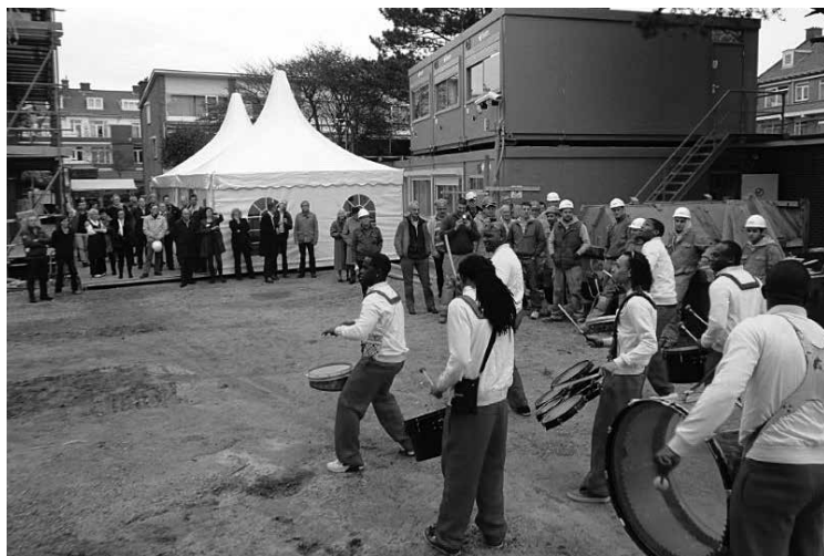
De Brassband The Legendsairs op het bouwterrein Dekkersduin

Op donderdag 31 oktober is het bereiken van het hoogste punt van de nieuwbouw van woonzorgcentrum Dekkersduin in de Campanulastraat gevierd. Met het hijsen van de Florence-vlag, een spetterend optreden van de Haagse brassband The Legendsairs en een speciaal woord van waardering voor de mensen op de bouwplaats is deze mijlpaal feestelijk omlijst.